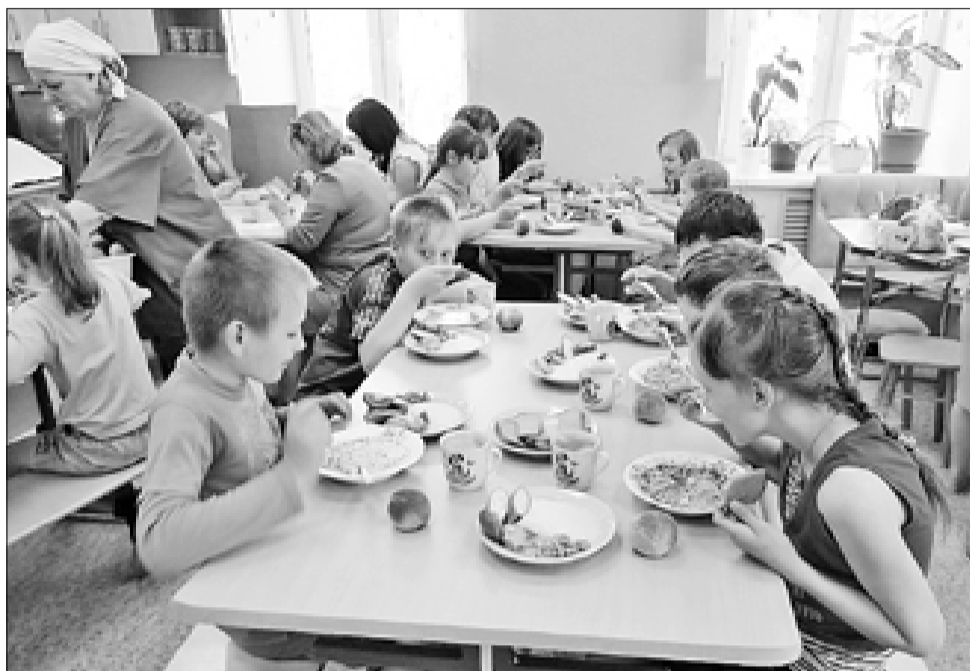
■ Питание и пребывание детей в лагерях – бесплатное.

В лагере «Вдохновение», который откроется в Исакогорском округе, будет царить дух приключений. Педагоги центра готовят для ребят увлекательную программу «Последний герой». Кроме того, дети побывают в парке аттракционов «Потешный двор» и на выставках в музеях Архан-