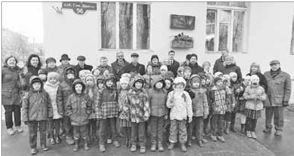
■ Ветераны ФСБ и учащиеся гимназии № 6 у мемориальной доски Даниилу Подоплекину.

Помощь также получит семья, пострадавшая в результате взрыва бытового газа в жилом доме № 25, корпус 3 по ул. Воронина.