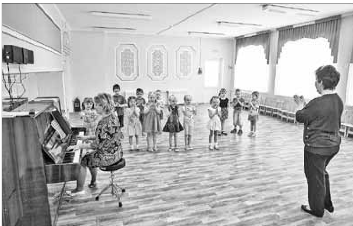
■ Современный детский сад, построенный в Северном округе, уже принял воспитанников.

За последние годы в Северном округе был построен большой де-