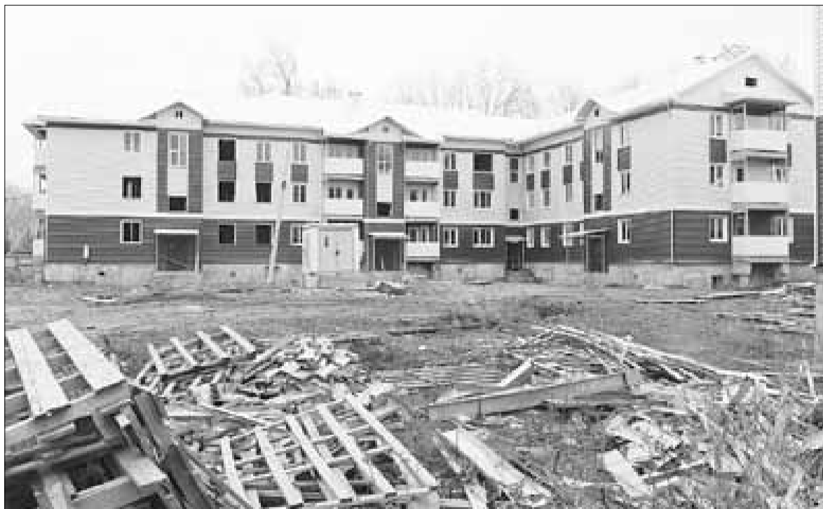
■ Дома на Доковской требуют достройки.

нейшего использования неизрасходованных средств на завершение строительства по ул. Доковской. Работы нами были продолжены. На 1 января 2013 года выполнено работ на сумму 124,9 млн рублей. На основании этого, с учетом ограниченных возможностей городского бюджета, обеспечить возврат средств фонда в требуемых объемах не представляется возможным».