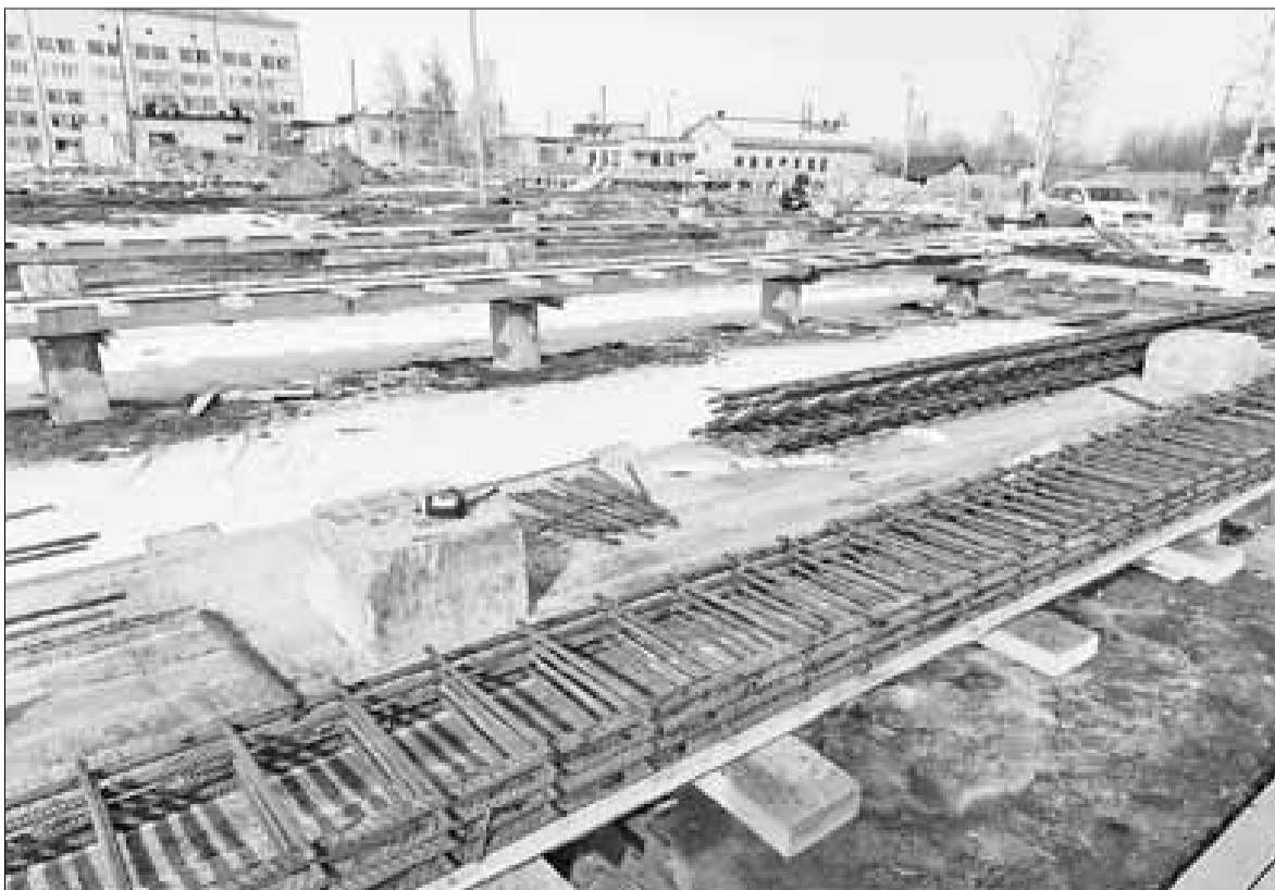
■ Строительство новых домов на ул. Конзихинской.

Мы можем оказаться в плохой для нас ситуации: участок отдадим концессионеру, а существующая свалка у нас будет закрыта. Кроме того, по существующему концессионному соглашению стоимость утилизации составляет порядка 800 рублей за тонну, сейчас тариф у «САХа» по утилизации мусора – порядка 300 рублей. Вы видите, что разница в тарифе почти в три раза. На кого