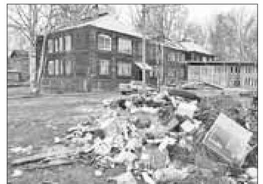
■ ул. Зеньковича, 16. ООО «УК «Жилкомсервис-Левобережье-2»