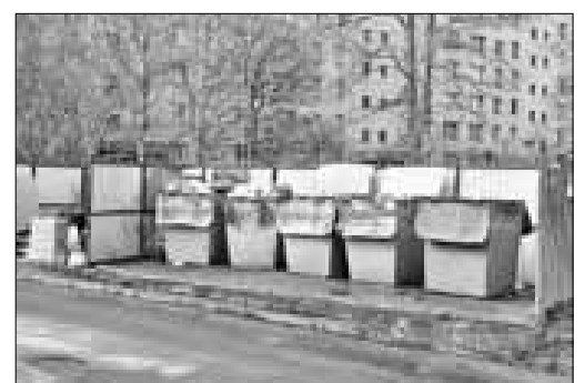
■ пр. Троицкий, 102. ООО «УК ЖД «Связькабельстрой»