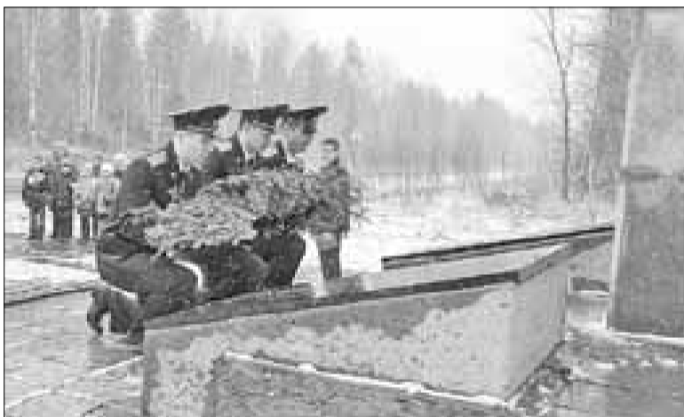
■ Возложение гирлянды к Обелиску Славы партизанам Севера