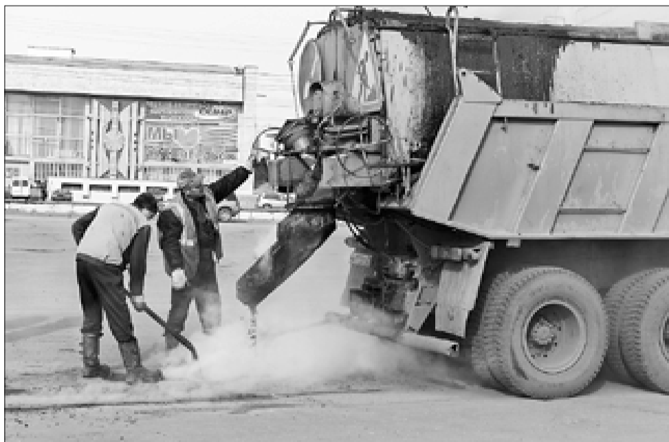
■ Дорожный ремонт на площади Профсоюзов.

Также ведется работа по передаче на госэкспертизу техзадания по ремонту 12 улиц в рамках средств, получаемых Архангельском из областного дорожного