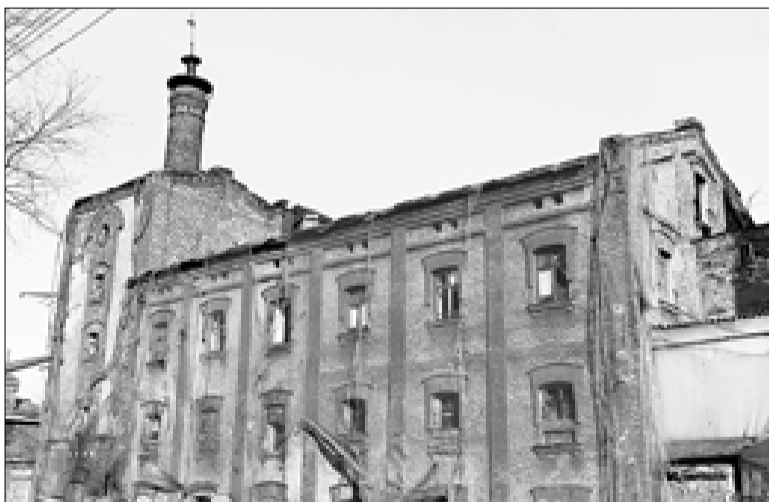
■ С конца 1980-х годов здания не использовались по назначению

В марте этого года в соответствии с законодательством был объявлен очередной аукцион, на который выставили главный корпус, солодовенный и безалкогольный цеха. По его итогам пивзавод продан (без земельного участка) за 34 миллиона 234 тысячи рублей. Покупателем стало