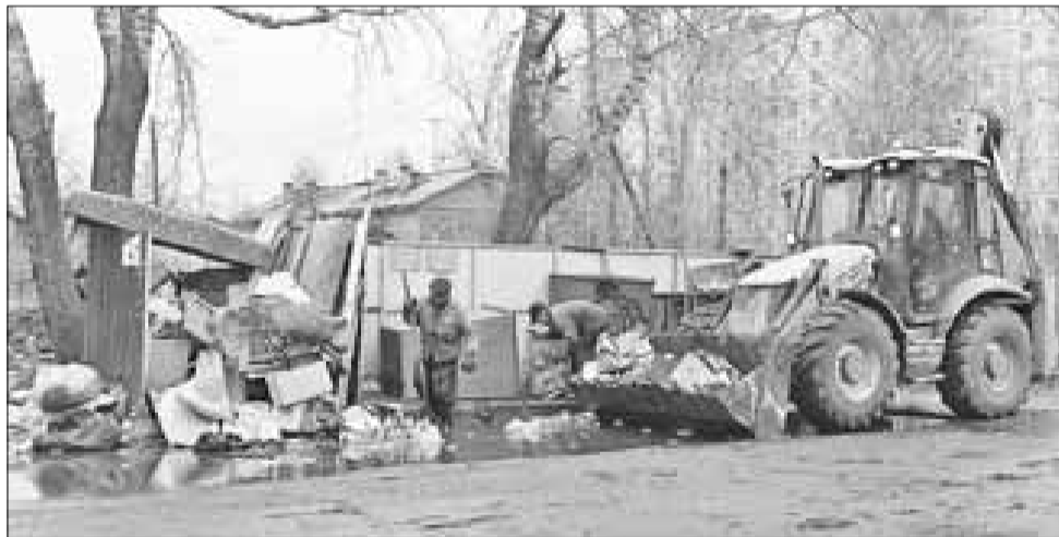
■ Своевременный вывоз мусора – залог чистоты.

Благоустройство: Важно синхронизировать работы по уборке и вывозу уже собранного мусора, чтобы черные мешки не «украшали» улицы города