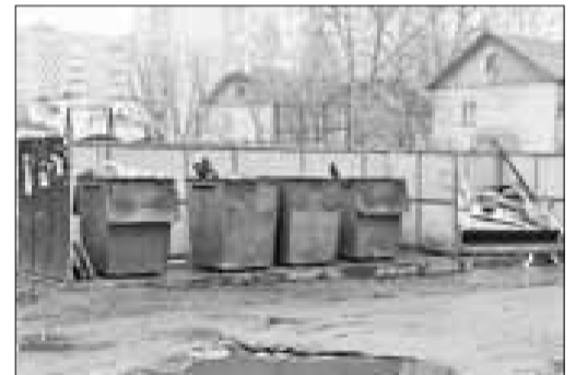
■ пр. Ломоносова, 278. ООО «Торн-1»

В рамках муниципального контракта по текущему содержанию дорог заделано более 200 квадратных метров выбоин, трещин и ям. В том числе эти работы выполнены на эстакадах – съездах с железнодорожного моста.